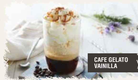
CAFE GELATO VAINILLA

Café, helado de chocolate, topping chocolate, nata y cacao en polvo.